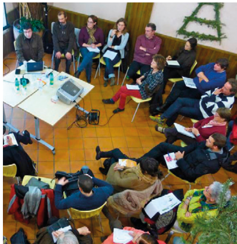
Un atelier lors de la 1 re édition des Éco-Dialogues Bédarieux-Pays d'Orb (Campotel)

Des représentants du Pays cœur d'Hérault, du Pays Haut-Languedoc et Vignobles, et du Parc naturel régional Haut-Languedoc Des représentants de communes ayant initié des projets de production d'énergies renouvelables dont les Communes forestières de l'Hérault